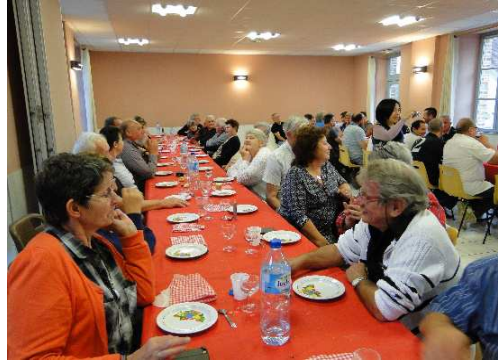
Repas au profit du CCAS Le 22 Octobre 2017