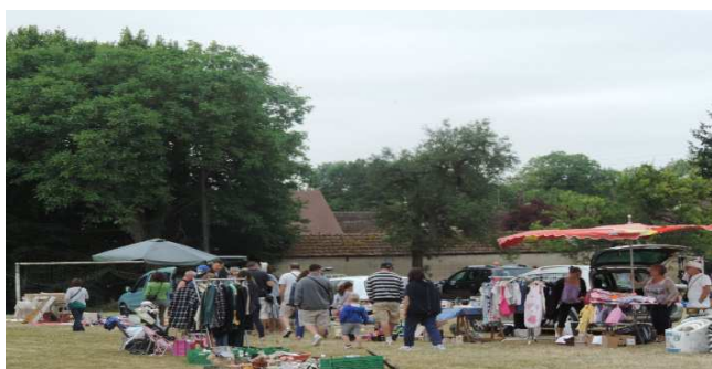
Brocante le 25 Juin 2017 sur le stade

Comme chaque année, le Comité Sports et Loisirs organise de multiples manifestations avec succès, ainsi que sa soirée Cabaret à Nogent sur Seine