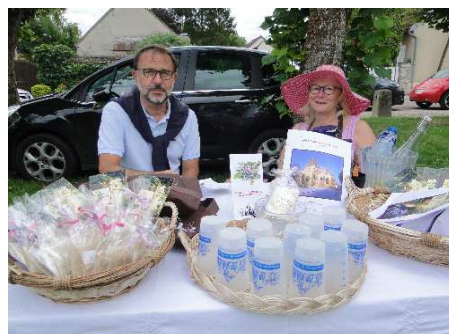
Fête Nationale du 14 Juillet 2017