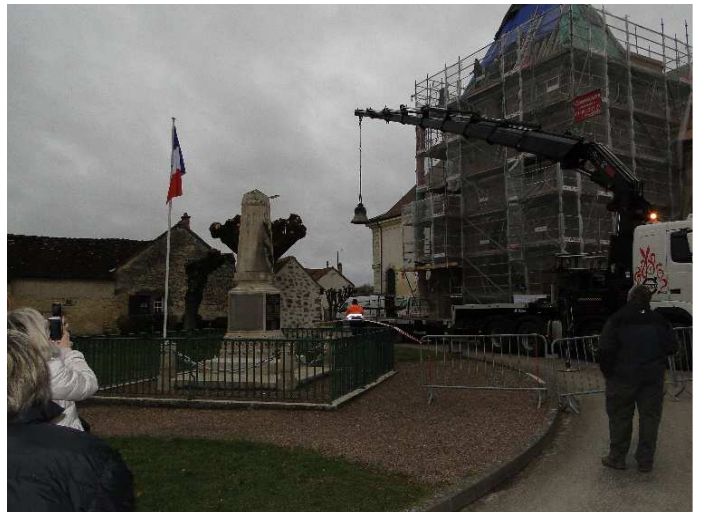
Descente de la cloche de l'Eglise le 28 Février 2017