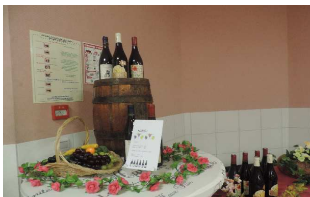
Soirée Beaujolais le 17 Novembre 2017