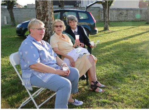
Fête des voisins Place de l'église Le 24 Mai 2017