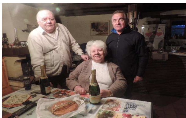
Distribution de galettes des rois aux personnes de plus de 70 ans