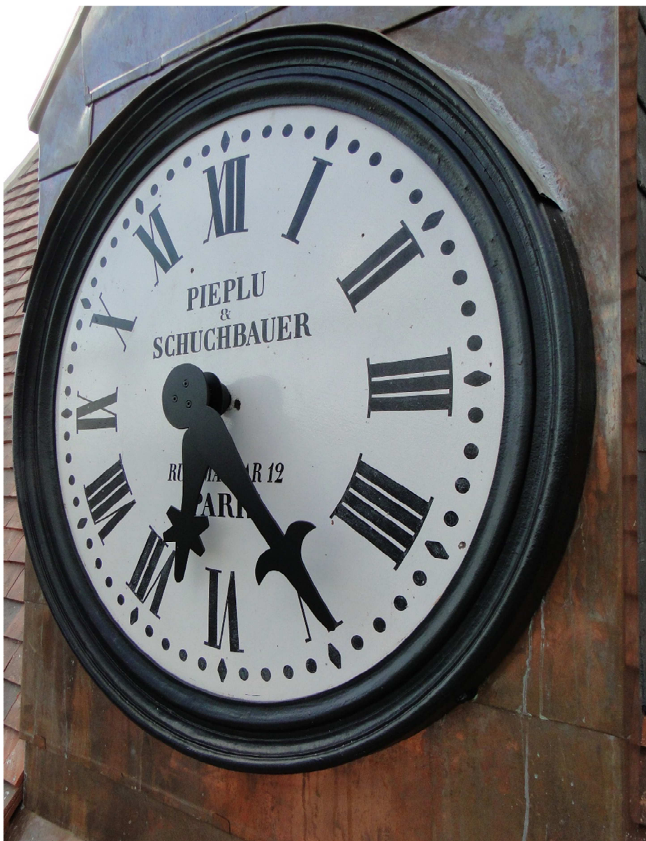
Continuité des travaux de rénovation de l'Eglise en 2017