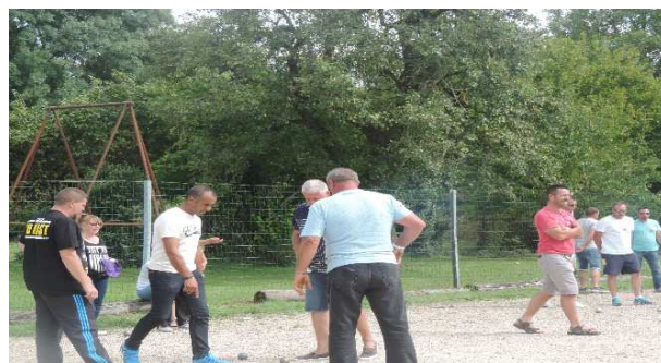
Pétanque le 03 Septembre 17